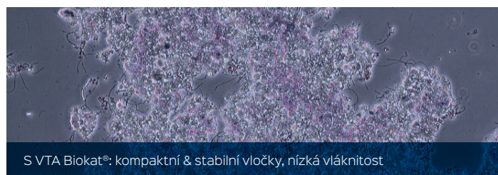
S VTA Biokat®: kompaktní & stabilní vločky, nízká vláknitost